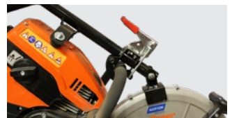
EINFACHE MONTAGE DES TRENNSCHLEIFES