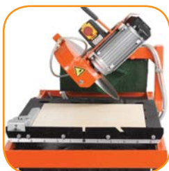
Schwenkbarer Kopf 0-45°.

* 150mm wenn das Material umgedreht wird.