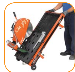
Transporträder für einen einfachen Transport.