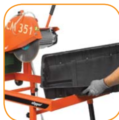
Leicht herausnehmbare Wasserwanne.