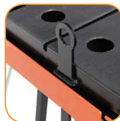
Stop System für den Rolltisch.