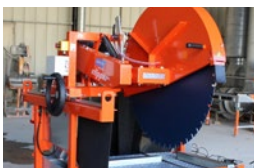
FÜR Ø 900 mm & Ø 1000 mm DIAMANTSCHLEIBEN