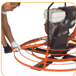
Transport der Maschine.