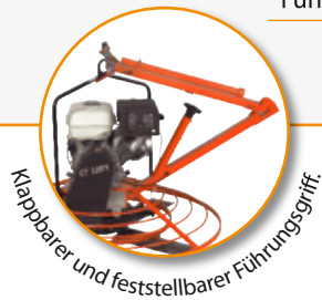
Klappbarer und feststellbarer Führungsgriff.