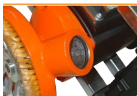
Anschlussmöglichkeit für Filteranlage

Diamant-Topfscheiben finden Sie auf Seite 24-25.